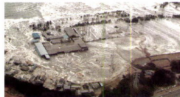
2011年 東日本大震災