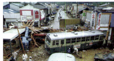
1982年 長崎大水害