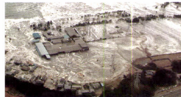
2011年 東日本大震災