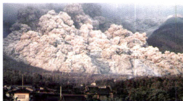
1991年 雲仙普賢岳噴火災害