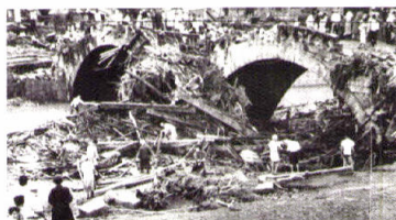
1957年 諫早大水害